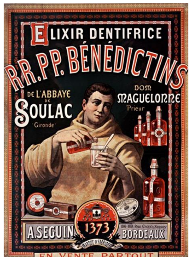
Collection Jacques Delenne