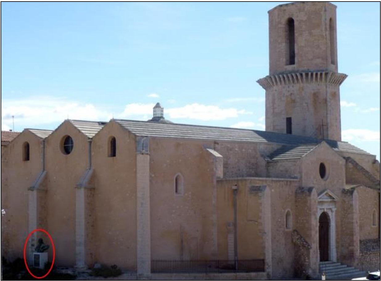
Le buste est adossé à l'église Saint Laurent