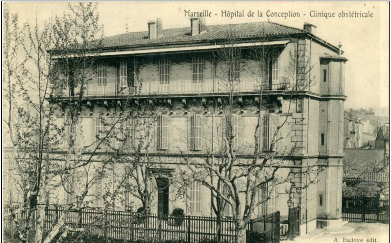
La clinique obstétricale de la Conception

En 1864 la maternité hospitalière ainsi que l'école de sages-femmes quittent le couvent des Grandes Maries, dépendance insalubre de la Vielle Charité, pour venir s'installer à la Conception. Elle est située à l'angle Sud-Est du bâtiment principal dont elle occupe le rez-de-chaussée du pavillon 6 et le pavillon 5.