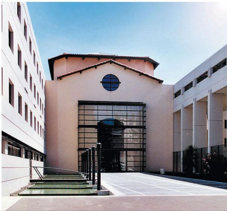
Direction générale de l'APH-HM, rue Brochier

Après la seconde Guerre Mondiale, la prison Saint Pierre perdit définitivement sa fonction carcérale. En 1957, un acte de vente de l'ensemble des bâtiments de la prison Saint Pierre est passé entre le Département des Bouches du Rhône et l'Assistance publique. Utilisée un temps comme rocade, en particulier par la pharmacie centrale, on y installa en 1994 la direction générale de l'APHM, en conservant la nef centrale.